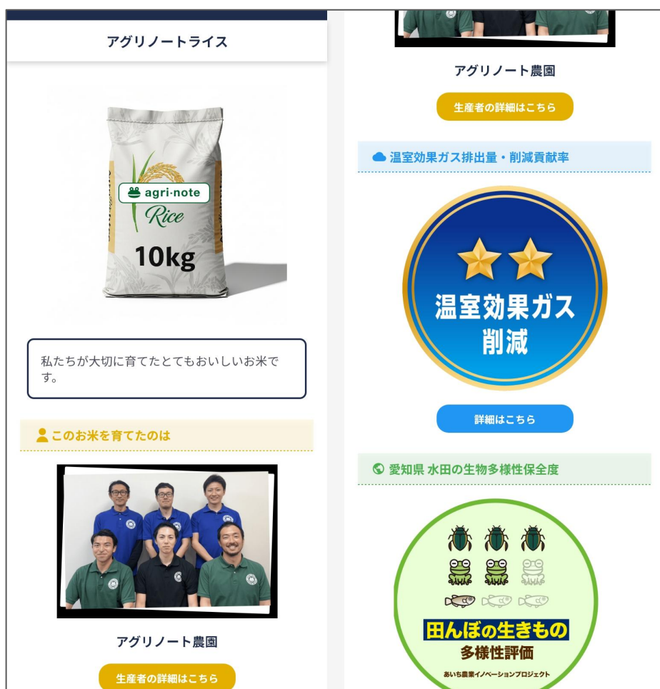
情報発信用webページのイメージ