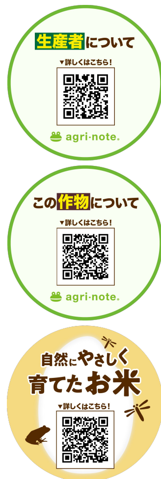
二次元コード付き画像のイメージ